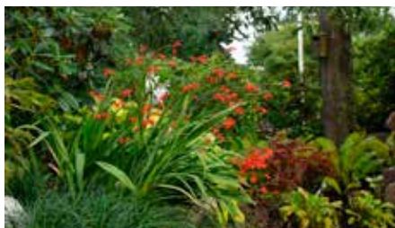
Stauder i Stenmaglehaven © Stenmaglehaven