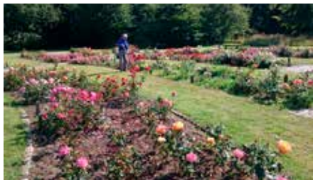
Arboretet i Gerlevparken