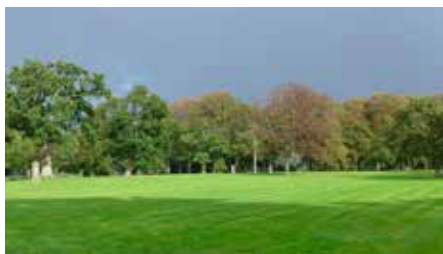
Parken ved Jægerspris