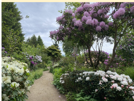
Lille Malunds Have, Malundvej 18, 8765 Klovborg

Der er følgende åbne haver i Ikast-Brande afdeling, se også www.haveselskabet.dk/abne-haver/