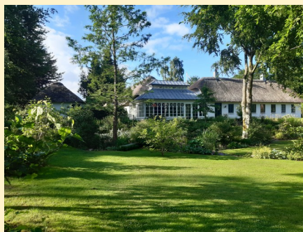
Haven i Hygild, Hygildvej 5, 7361 Ejstrupholm