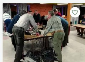
Kurser og workshops

6/2 2024, kl. 18:30 - 21:30 Sognehuset, Kirkegade 7, 7182 Bredsten