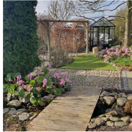
Helle Aagaards Have på Sydfyn