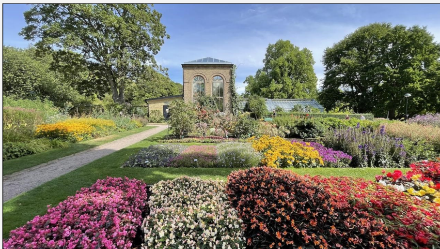
Lund Botaniske Have

Efter besøget her, køres videre til Jönköping med vores overnatningshotel og aftensmad. Hotel: Clarion Collection Hotel Victoria.