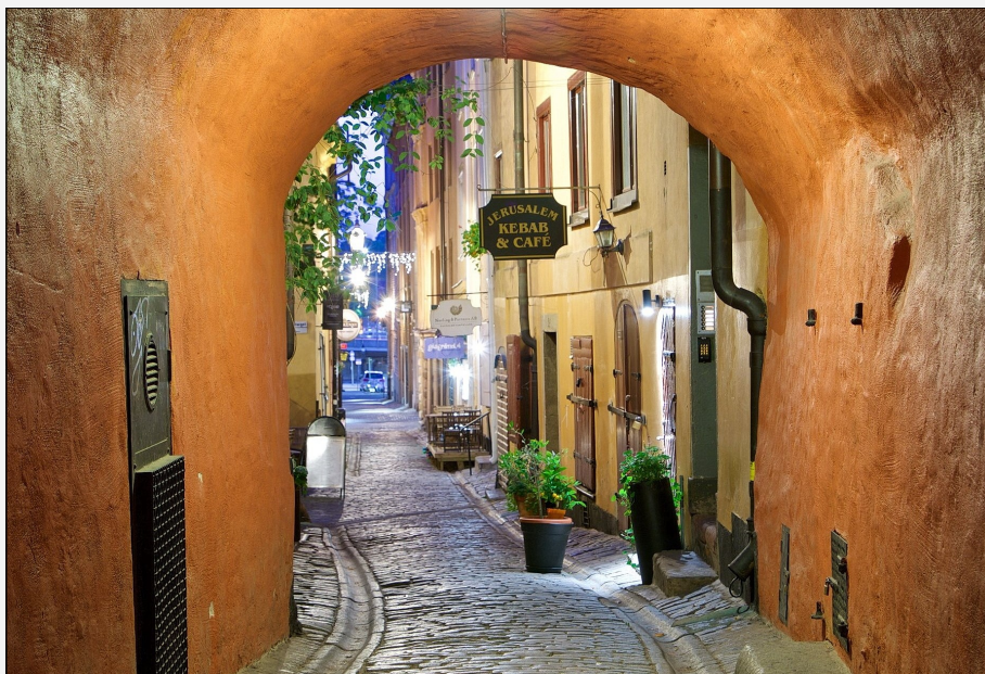
Parti fra Gamla Stan

Mulige besøgssteder i Stockholm: Kungsträdgården, Bergianska trädgården, et utal af parker, museer, evt. en hop-af-og-på bådture rundt til forskelle steder i byen eller noget helt andet.