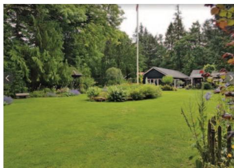
Gerhard Tambours have.