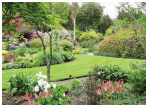
Lille Malunds have.