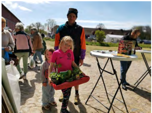
En heldig vinder fra sidste år.