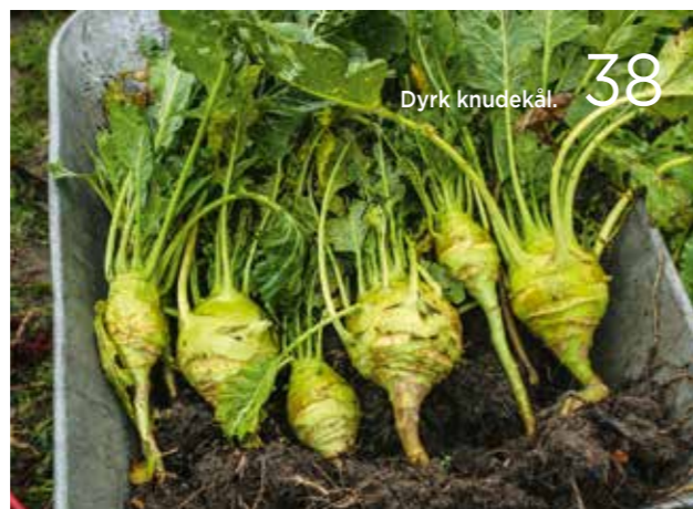
Dyrk knudekål. 38