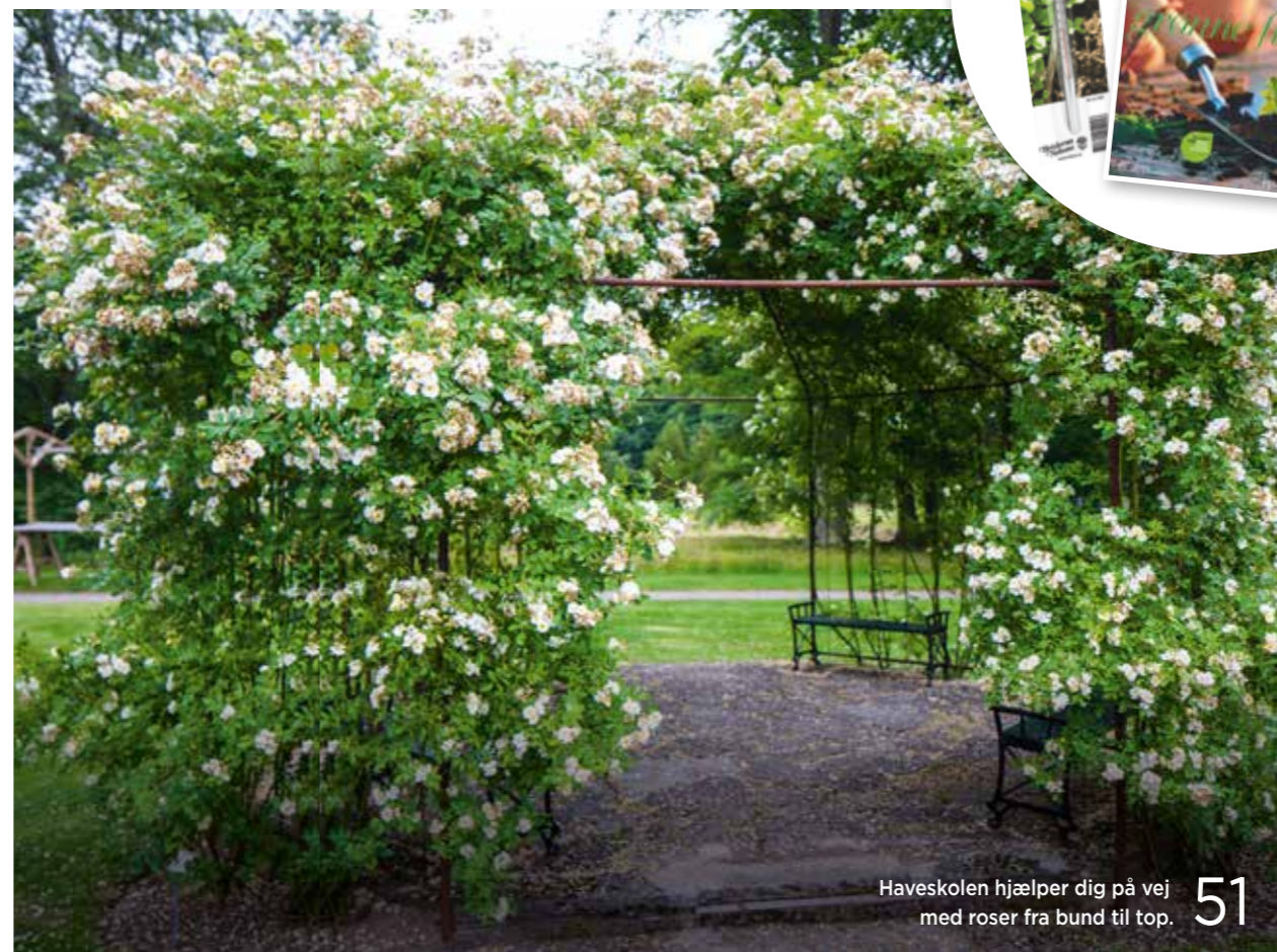
Haveskolen hjælper dig på vej med roser fra bund til top. 51